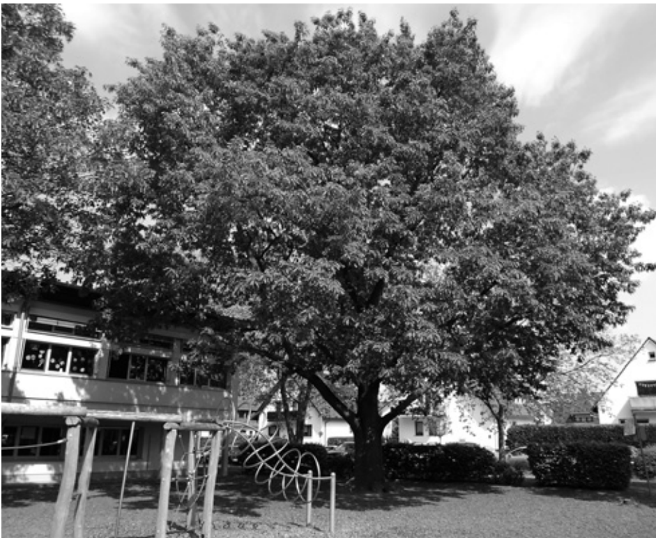
Sie stand schon, als hier noch gar keine Schule war: Diese schöne Eiche mit einem Stammumfang von 270 cm dürfte gut 100 Jahre alt sein. Wenn es nach den Plänen des Kreises geht, wird sie nicht mehr viel älter werden.

Man konnte es beim Neubau der Waldenserschule in der Waldstraße gerade wieder erleben: Der Erhalt des wertvollen, alten Baumbestands spielt bei Planern, Architekten und Bürokraten – Bauherr ist hier die Kreisverwaltung Groß-Gerau – meist keine Rolle. 2012 hatte das Architekturbüro die Ausschreibung noch mit dem Versprechen gewonnen, dass die meisten bestehenden großen Bäume erhalten bleiben und integrieren werden sollen. Doch heute steht im östlichen Bereich kein einziger Baum mehr.