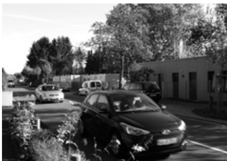
Eigentlich unglaublich: Tempo 30 vor der Kita 11 auf dem engen und vielbefahrenen Nordring wurde abgelehnt.

Die GRÜNE-Fraktion hatte im Stadtparlament beantragt, noch bestehende Lücken bei den Tempo-30-Zonen in unserer Stadt zu schließen und mehr Sicherheit vor Kindertagesstätten und Schulen zu schaffen.