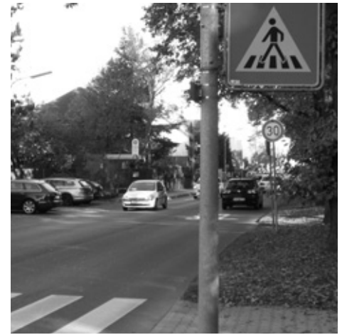
Vorbei mit Tempo 30: Vor der Kita 1 an der Farmstraße soll demnächst wieder gerast werden.

Ziel ist es, die Verkehrssituation vor dem Eingangsbereich übersichtlicher zu gestalten und die Gefährdung der Kinder zu reduzieren. Dazu kann ein Halteverbot im Eingangsbereich sinnvoll sein. Ebenso ist an die Einrichtung von „Hol und Bring-Zonen“ zu denken, die in einem gewissen Abstand vor Kita bzw. Schule als Elternhaltestelle dienen und den Kindern die Möglichkeit geben sollen, eigenständig die letzten Meter zur Einrichtung zu-