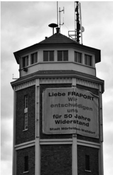
Der neue Lärmschutz à la SPD und Freie Wähler (Fotomontage)

DIE GRÜNEN Mörfelden-Walldorf kritisieren die Flughafenpolitik der neuen Mehrheit im Stadtparlament scharf. Mit ihrem ersten inhaltlichen Antrag hatte die neue Koalition aus SPD, Freie Wähler und FDP im Stadtparlament am 12.07.2016 beschlossen, die Banner mit der Forderung nach einem echten Nachtflugverbot von 22–6 Uhr und einem Ausbaustopp des Flughafens aus der Stadt zu entfernen. Man wolle in Zukunft auf die Fraport zugehen und Kooperationsbereitschaft zeigen.