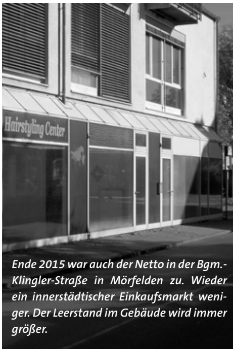
Ende 2015 war auch der Netto in der Bgm.-Klingler-Straße in Mörfelden zu. Wieder ein innerstädtischer Einkaufsmarkt weniger. Der Leerstand im Gebäude wird immer größer.

Für die GRÜNEN ist klar, dass jeder Ausbau des Einzelhandels an den Ortsrändern den Bestand der wenigen, noch verbliebenen innerstädtischen Einkaufsmärkte wieder ein Stück mehr gefährdet. Direkte Auswirkungen dürfte die Erweiterung des alten Lidl zu einem „Mega-Markt“ auch auf die Bemühungen haben, in der Bürgermeister-Klingler-Straße in Mörfelden einen Nachfolger für den ehemaligen Netto-Markt zu finden. Ob sich hier jemals wieder ein Nahversorger ansiedelt, erscheint inzwischen immer fraglicher. Ein Discounter mit einer die Konkurrenz weit übertreffenden Verkaufsfläche wird künftig auch vermehrt Kunden aus dem Stadtteil Walldorf anziehen und damit zum unnötigen Anwachsen des innerstädtischen Verkehrs beitragen.