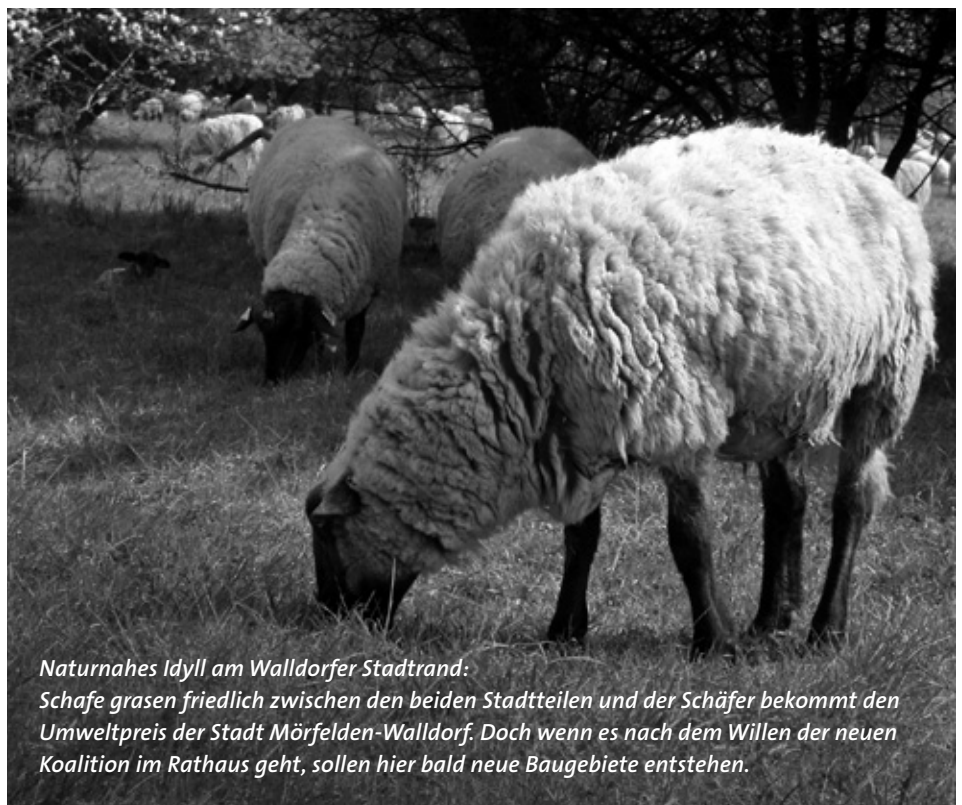
Naturnahes Idyll am Walldorfer Stadtrand: Schafe grasen friedlich zwischen den beiden Stadtteilen und der Schäfer bekommt den Umweltpreis der Stadt Mörfelden-Walldorf. Doch wenn es nach dem Willen der neuen Koalition im Rathaus geht, sollen hier bald neue Baugebiete entstehen.