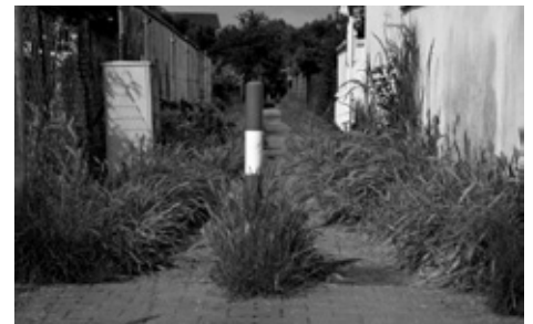
Hüft Hohes Gras behindert Fußgänger und Radfahrer (oben), Blumen am Rand des Mörfelder Mühlpfädchen (unten)

Die GRÜNEN fordern, dass Strafandrohungen bei Pflanzungen im öffentlichen Raum zukünftig unterlassen werden und Bürger stattdessen bei ihrem Engagement von der Stadt unterstützt und gefördert werden. Das haben SPD, FW und FDP allerdings prompt abgelehnt.