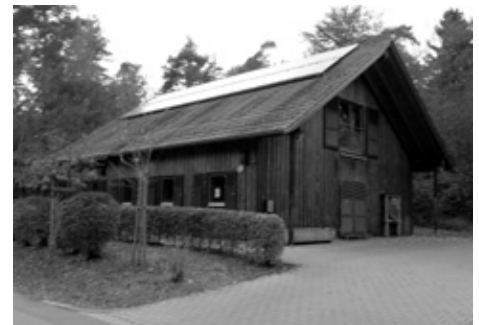
Waldkita „Die Wühlmäuse“ Nieder-Roden, Waldkita Dreieich, Kita „Waldgeister“ Groß-Zimmern (von oben nach unten)