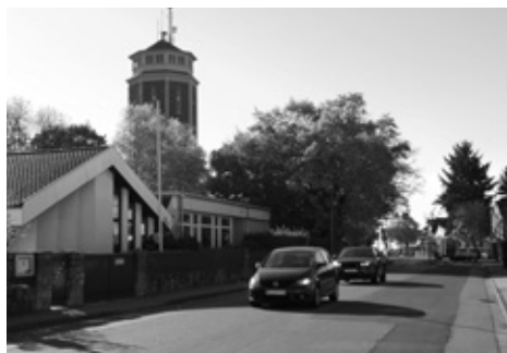
Vor dem katholischen Kindergarten in der Frankfurter Straße wird weiter Tempo 50 (und mehr) gefahren.

Neue Koalition will die Zeit zurückdrehen