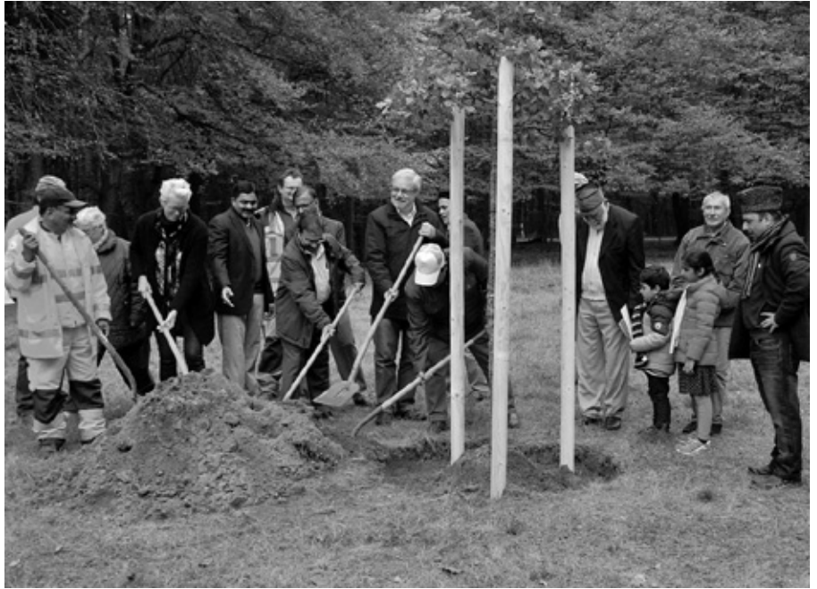
Eine weitere Baumpflanzaktion der Ahmadiyya-Gemeinde in Zusammenarbeit mit dem Umweltamt der Stadt am alten Grillplatz Walldorf: 5 Eichen wurden hier von dieser pakistanischen Religionsgemeinschaft gesetzt und finanziert.