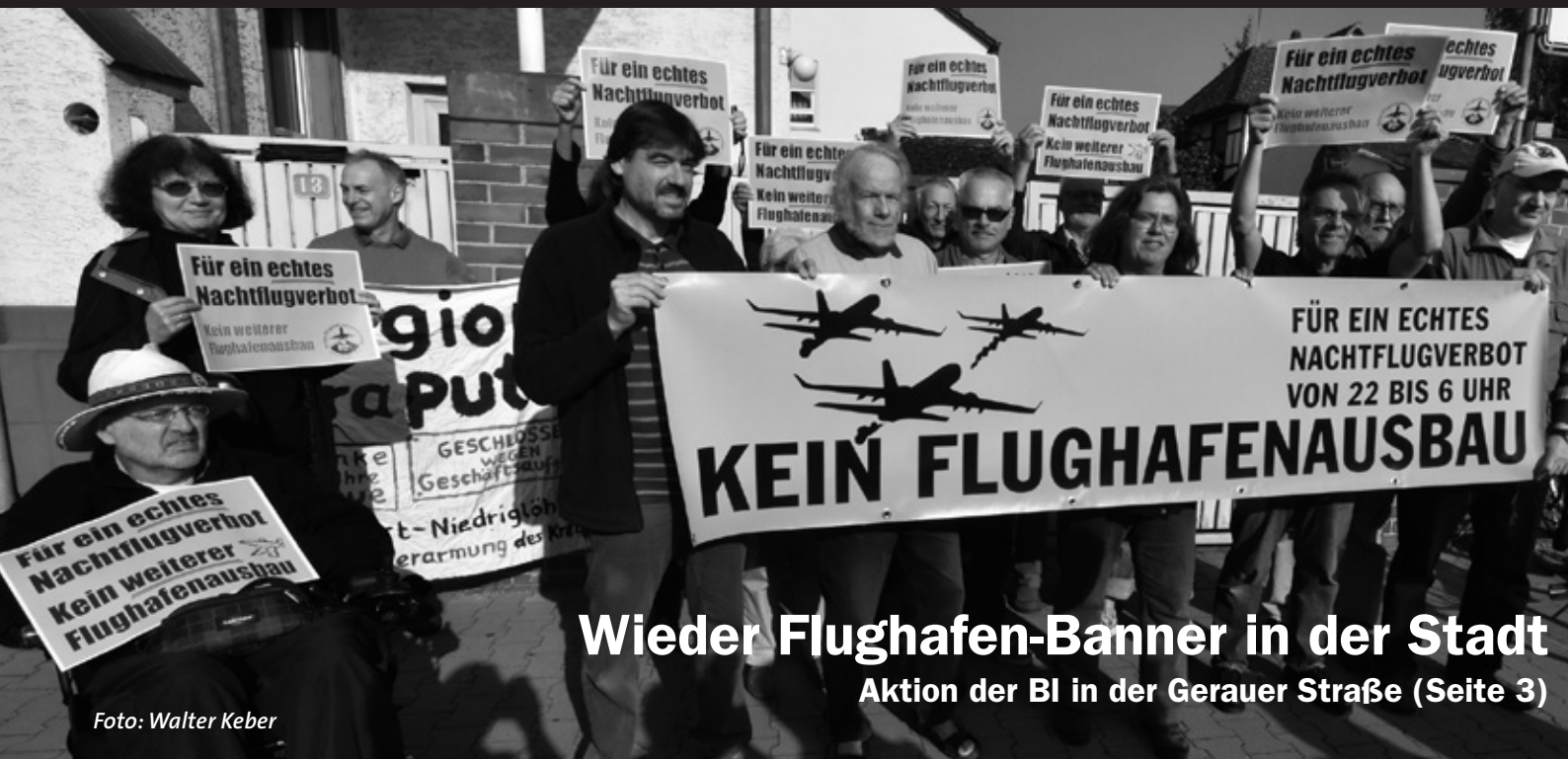
Wieder Flughafen-Banner in der Stadt Aktion der BI in der Gerauer Straße (Seite 3)

Flughafenbanner • CETA+TTIP • Neue Koalition • Tempo 30 • Klimaschutz • Neubau Lidl-Markt Betriebsstraße • Sozialwohnungen • Behördenposse Mühlpfädchen